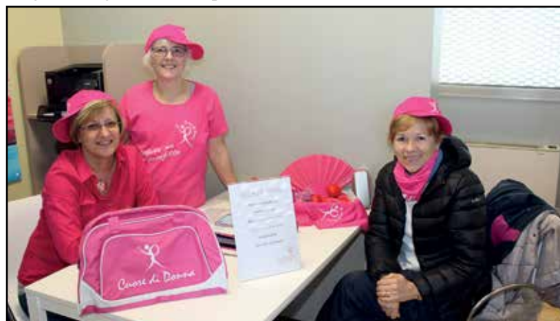
Alcune responsabili dell'Associazione.

"CUORE DI DONNA" è una Associazione che non ha scopo di lucro ed è apolitica, nata dalla forza di un gruppo per sostenere il cammino delle donne che affrontano il tumore al seno e per diffondere la cultura della PREVEZIONE.