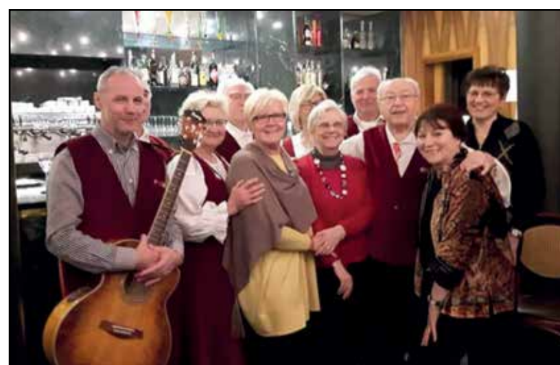
Gli attori con la vedova Boifava.

"Ghè riàt mars sö chésta tèra-per maridà 'na scèta bèla- la pö bèla che gha sìa- va nel prà che ghè l'umbria- e l'umbria l'è nel prà-ghè 'na scèta de maridà- chè éla?- chè nó éla? L'è... (nome ragazza)- chè gha dóme?... (nome ragazzo)- Coro che grida, picchiando sugli "strumenti": dóme-ghel, dóme-ghel!- e per dóta?- 'na pèl de àca morta- cosa gha dóme per ór?- l'anèl del tòr- cosa gha dóme per uricì?- do ròde de mulì- e per coèrta?- dò pèi dè lös-erta- e per cusì?- un bór de spì- Il silenzio permetteva che queste