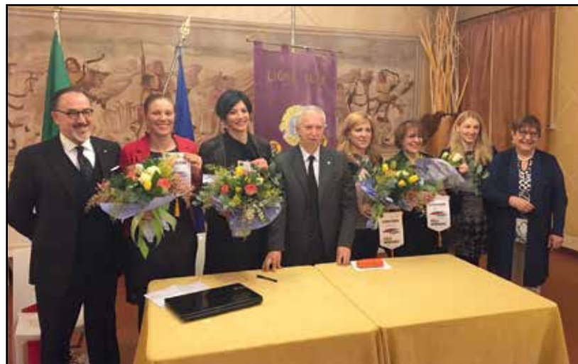
Il Presidente e l'addetto stampa con le rappresentanti dell'Istituto Comprensivo Renato Ferrari.